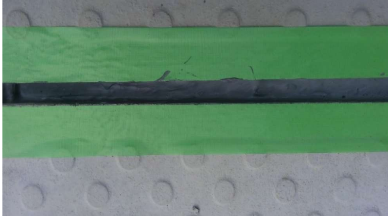
(ネパールを塗布した状況)