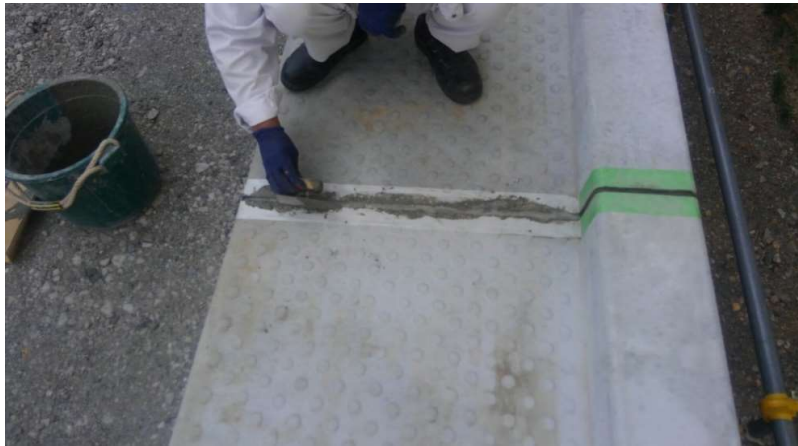
④無収縮モルタル充填